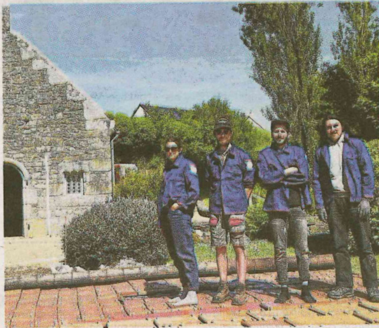
Une fois terminée, l'œuvre sera tendue et formera un tapis mobile articulé.

Une des premières œuvres, Statio, est à découvrir à Kernouës.