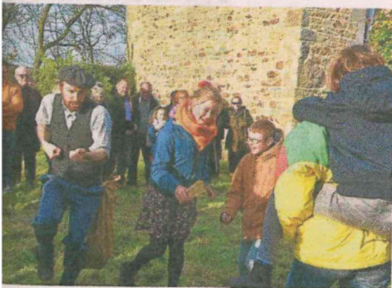
Vime d'une joute qui aurait pu se produire au manoir, avec des spectateurs volontaires.

voulait du bois pour se chauffer en enfer, sur la côte nord, et qui a passé un « accord » avec les propriétaires d'alors. Puis, passage vers les magnifiques camélias, là où il paraîtrait que des joutes auraient eu lieu. Rires et participation du public au programme. Avant de se quitter et de partager gâteaux breton et jus de pomme, la prophétie a été livrée : « À la prochaine pleine lune quand les arbres seront verts, un homme viendra à l'aube et avec lui apportera la paix ».