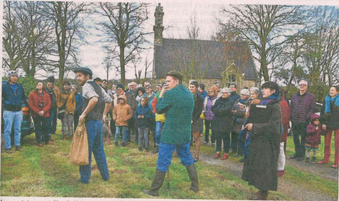
Les spectateurs ont déambulé dans l'enceinte du manoir au gré des histoires.

Tout juste arrivé au Manoir de Kergoff, le spectacle « La prophétie des Kergoff » commence. Accueillis par Pol, le gardien des lieux, qui s'occupe « principalement des pierres », comme il le dit en se présentant, par Sébastien, son frère, pour qui les fleurs du parc n'ont aucun secret, et par Émilie, la nouvelle maîtresse de maison.