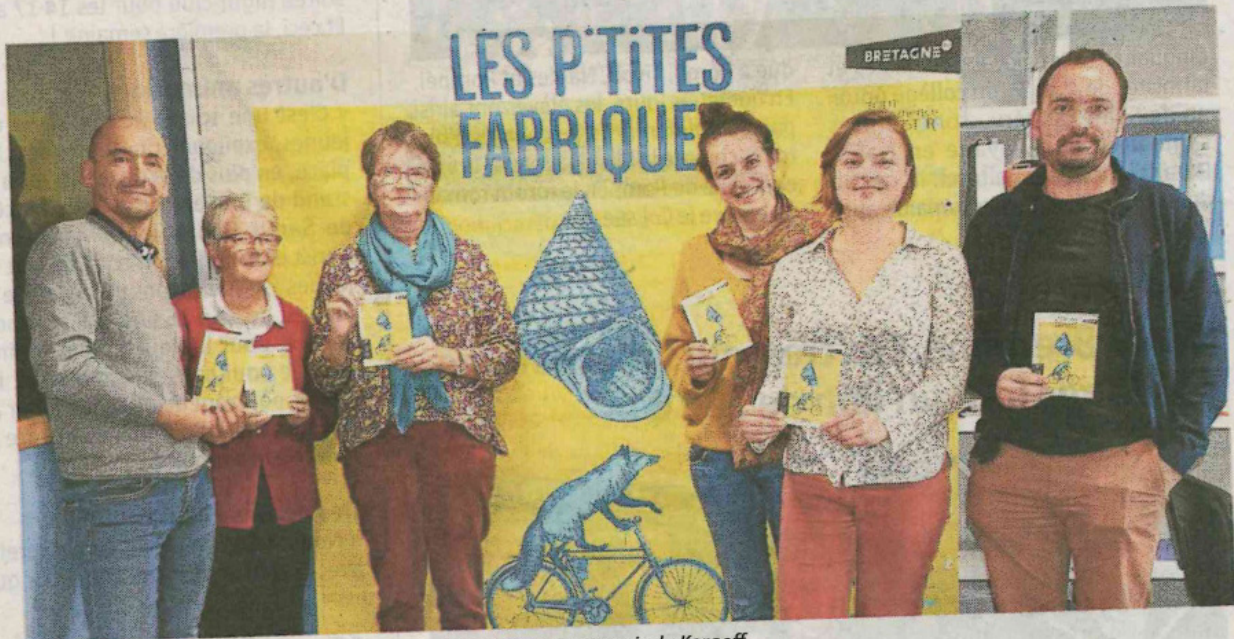
Les P'tites fabriques commencent dimanche 20 octobre, au manoir de Kergoff.

Forte de son succès, la Fabrique d'imaginaire revient cet automne. Un ciné-concert à l'influence inuit, dimanche, inaugure cette nouvelle saison.