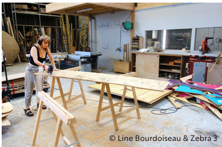
© Line Bourdoiseau & Zebra 3